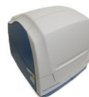
Varioskan Flash (Thermo SCIENTIFIC社)