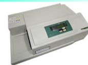
VersaMax (Molecular Devices社)