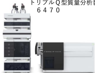
検査装置：Agilent製 トリプルQ型質量分析装置 6470

LCで分離された成分は、質量分析装置に入りイオン化されます。初めに目的のプレカーシオンを選択し、続くコリジョンセルで不活性化ガスと衝突させ断片化します。さらに、プロダクトイオンを選択することにより、高選択性・高感度の定量分析が可能になります。