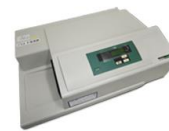
VersaMax (Molecular Devices社)