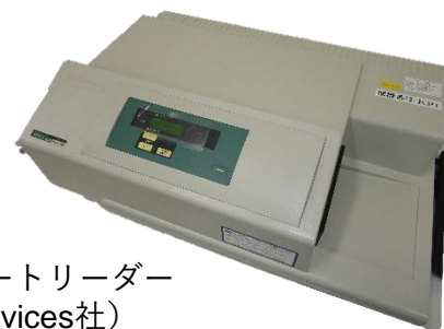
VersaMax™ マイクロプレートリーダー (Molecular Devices社)