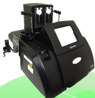
GloMax®-Multi Detection System (Promega社)