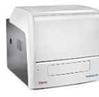
Varioskan LUX (Thermo Scientific社)